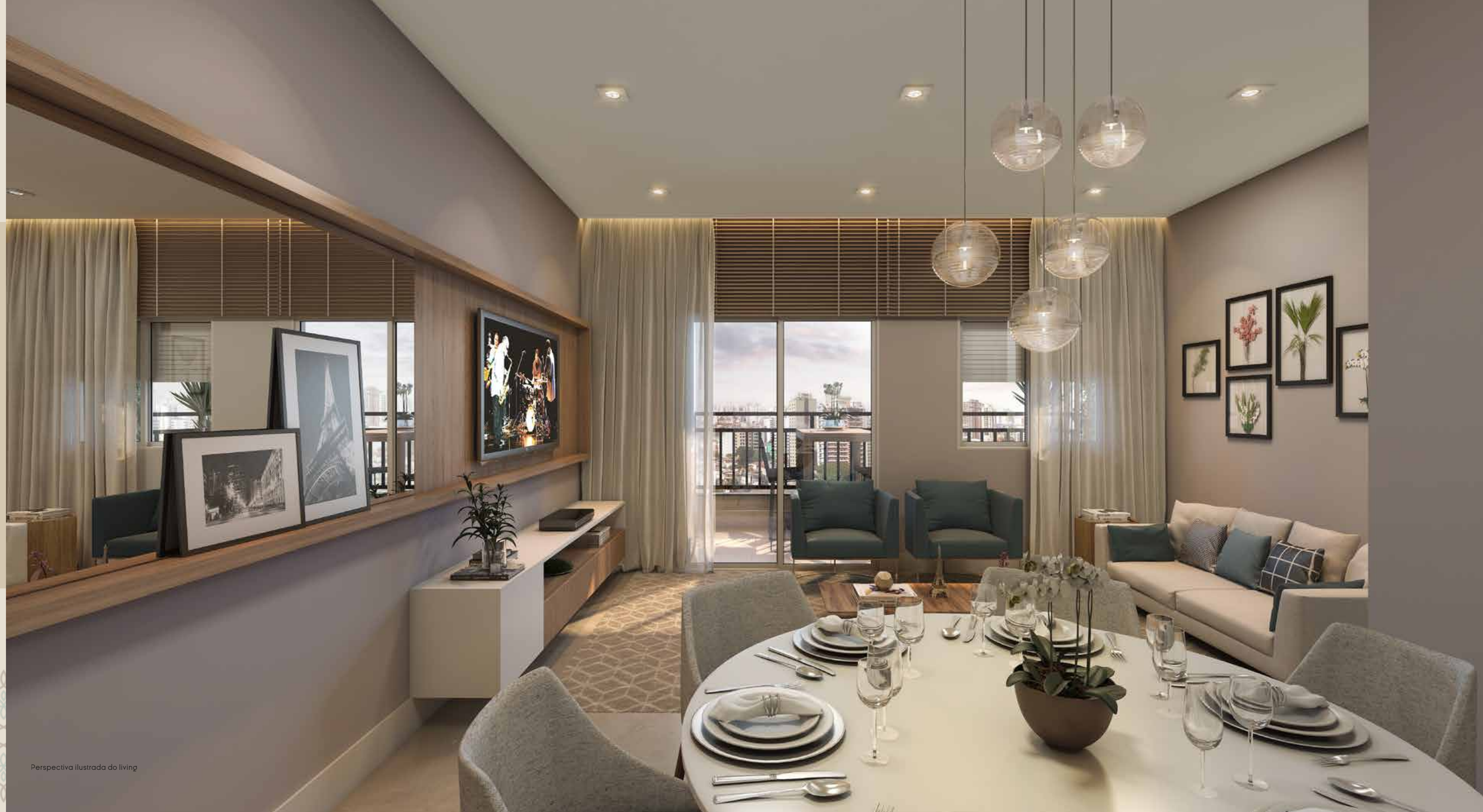
Perspectiva ilustrada do living

CONFORTO E DESIGN EM HARMONIA PERFEITA COM O SEU ESTILO DE VIVER.