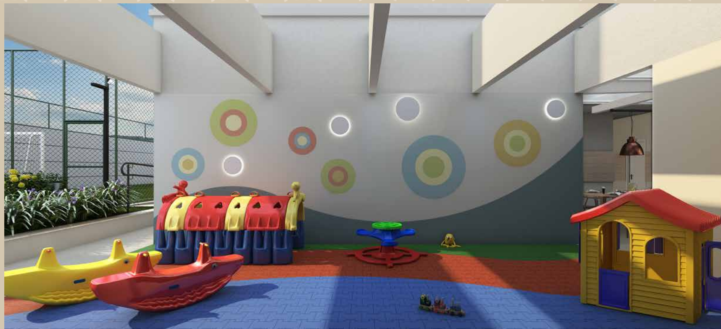
Perspectiva ilustrada da brinquedoteca

PARA QUANDO OS PEQUENOS QUEREM SE DIVERTIR. OU SEJA, SEMPRE.