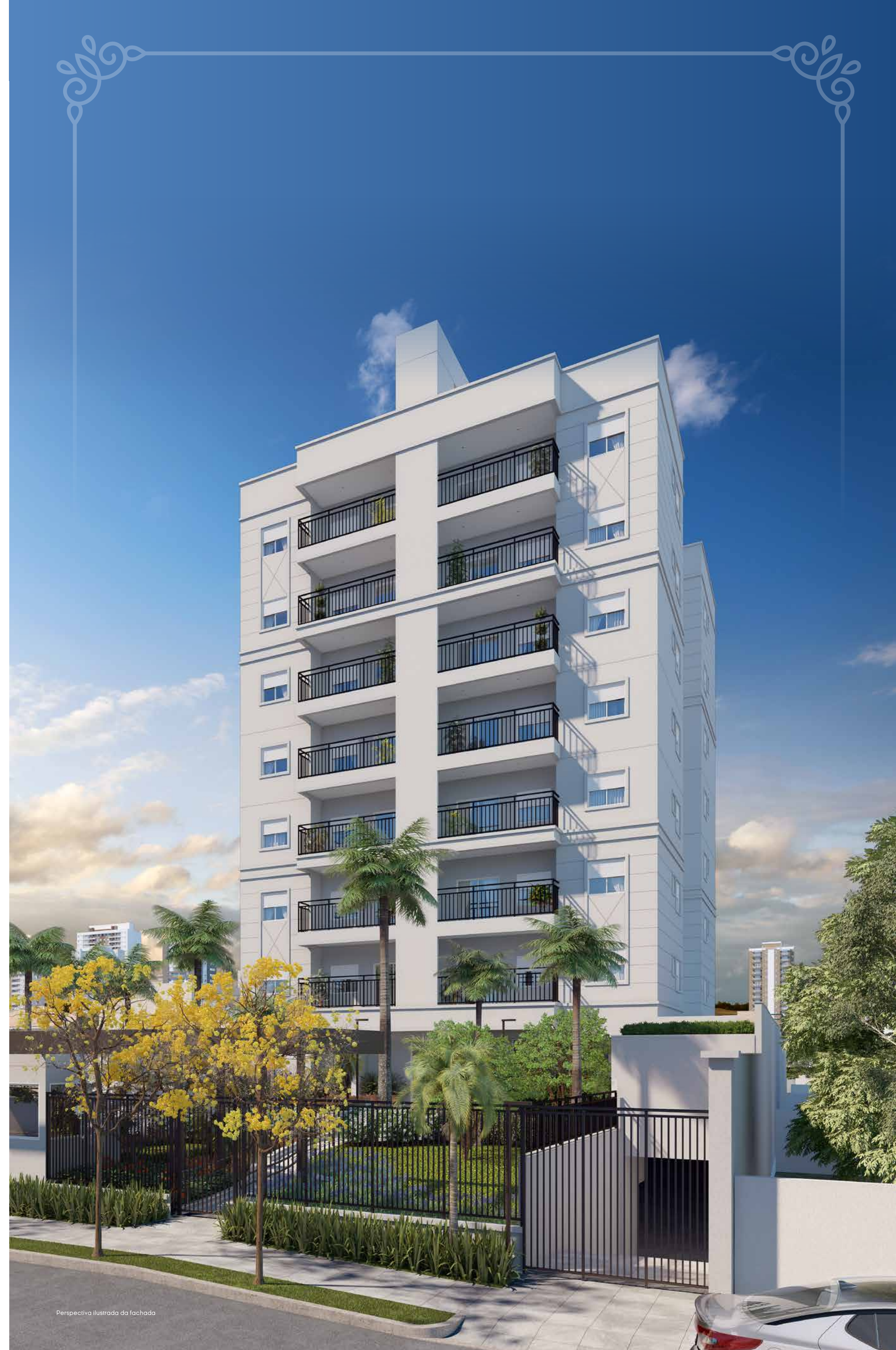
Perspectiva ilustrada da fachada