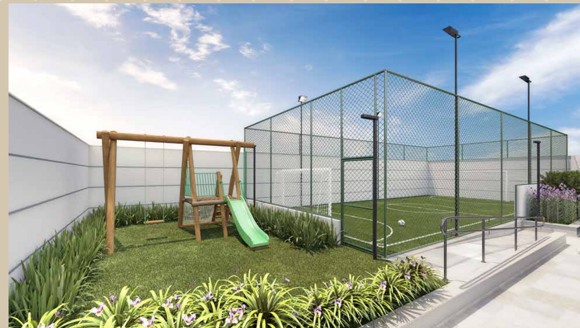
Perspectiva ilustrada do playground

PARA QUANDO OS PEQUENOS QUEREM SE DIVERTIR. OU SEJA, SEMPRE.