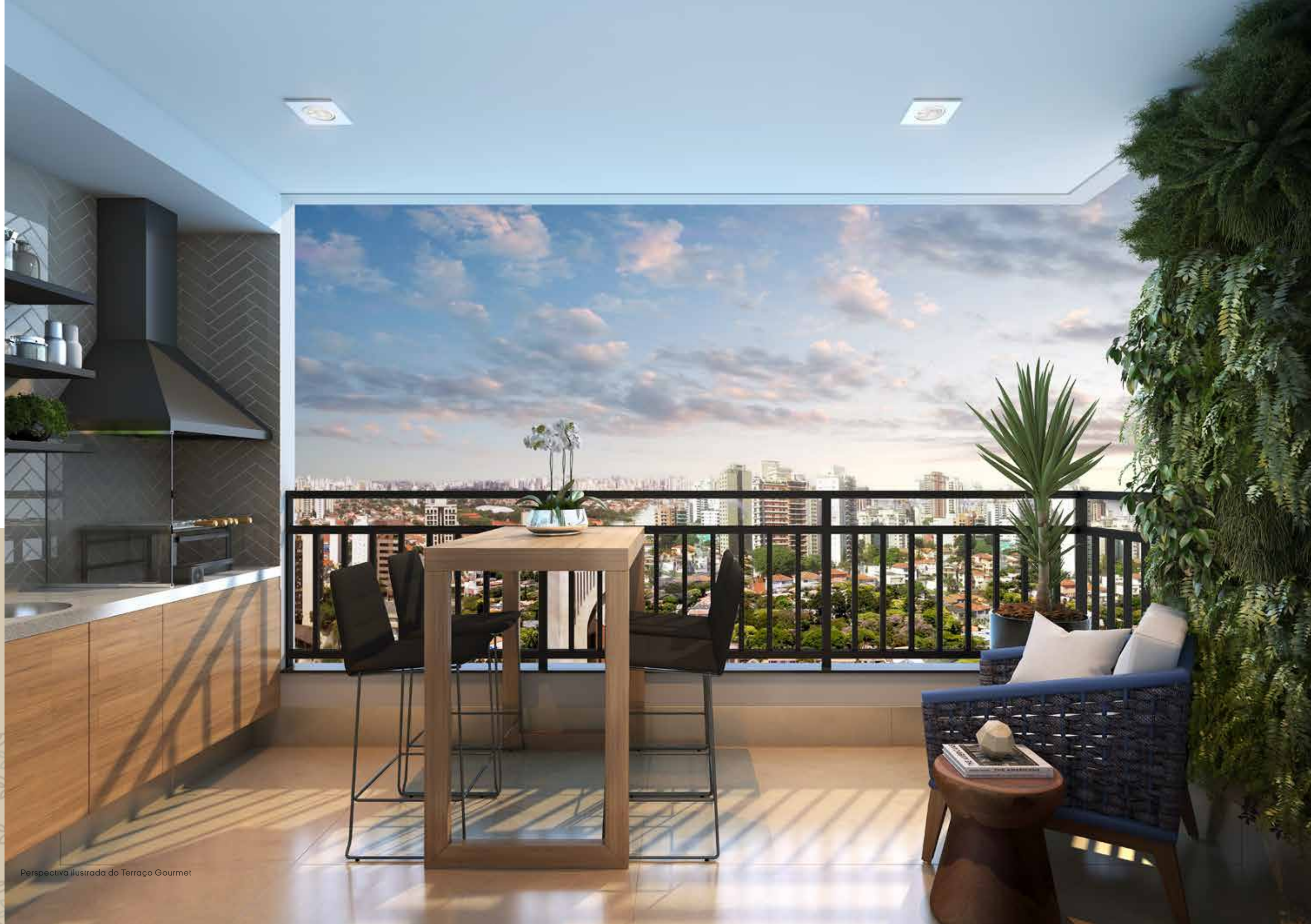
Perspectiva ilustrada do Terraço Gourmet

A MELHOR VISTA PARA O CAMPO BELO VAI SER A SUA.