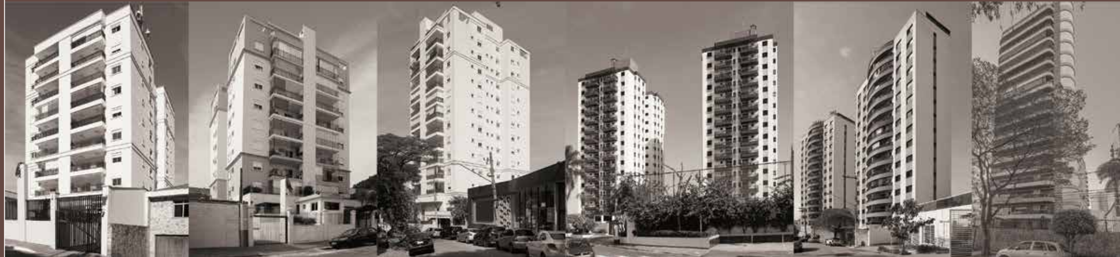
Piazza Di Francesco