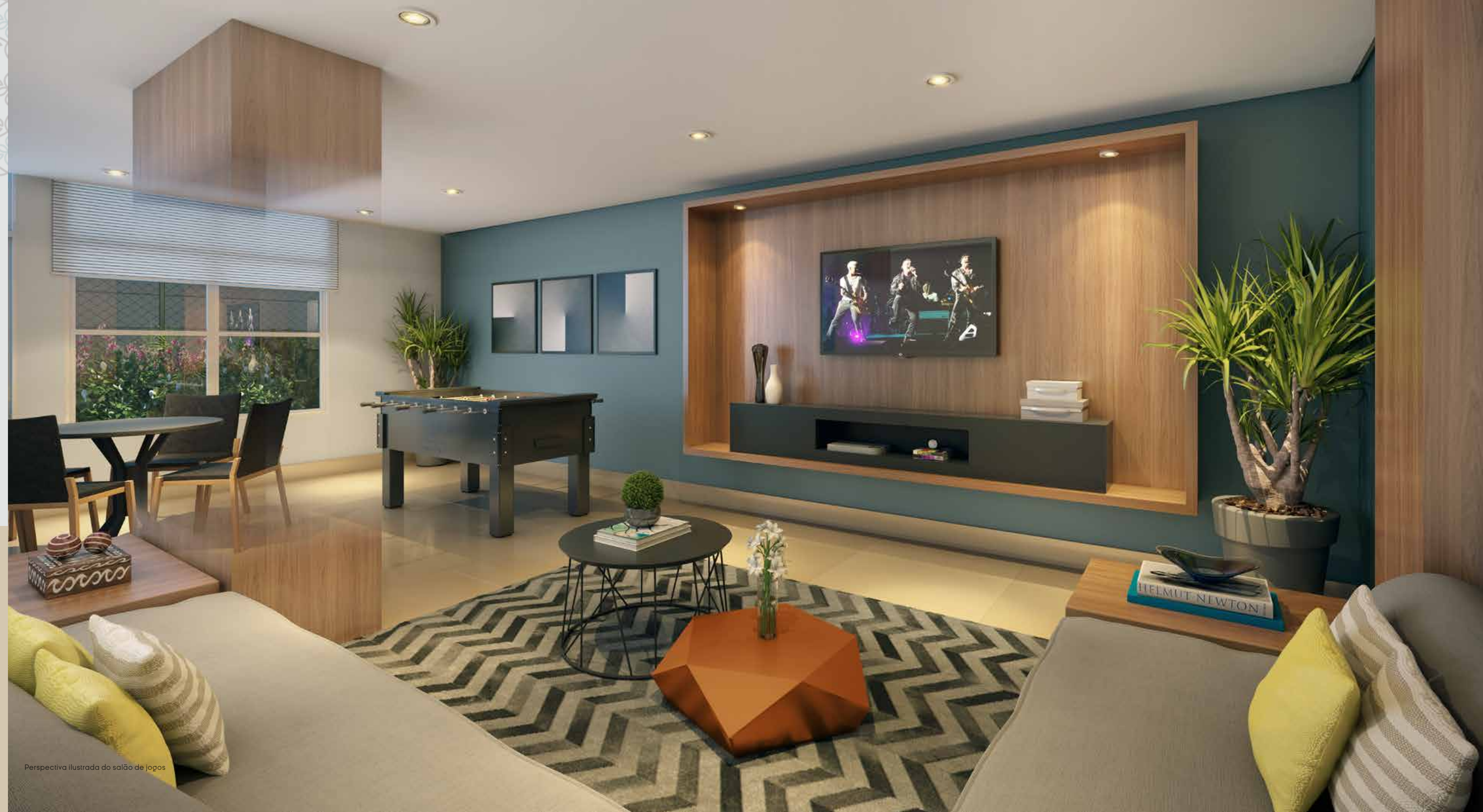
Perspectiva ilustrada do salão de jogos

UMA BOA APOSTA É REUNIR OS AMIGOS EM UM SALÃO DE JOGOS BELO E COMPLETO.